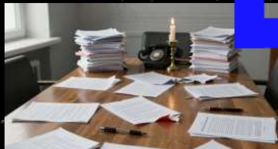
Внутренние конфликты, проявляющиеся публично

Разногласия внутри организации, выходящие в публичную плоскость, усиливают негатив и создают впечатление непрофессионализма, что уменьшает поддержку и финансирование.