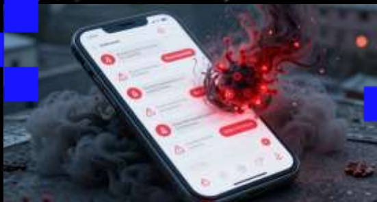
Массированные жалобы и вирусное недовольство

Негативные отзывы быстро накапливаются, вызывая резкое падение доверия к организации. Распространение недовольства может перерасти в массовое протестное движение в соцсетях.