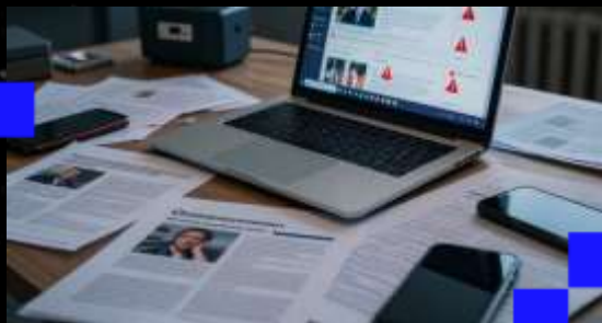
Информационные атаки и манипуляция фактами

Конкуренты или недоброжелатели могут распространять искаженную информацию, подрывая репутацию НКО и вызывая напряжение среди аудитории и партнёров.